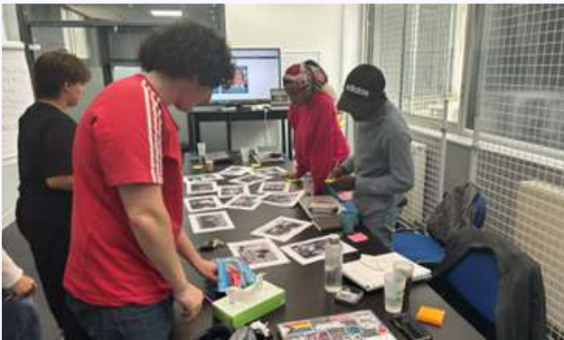
Ateliers sur la méthodologie d'éducation populaire