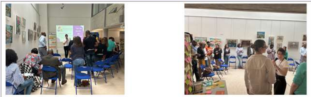
Ateliers sur la méthodologie d'éducation populaire