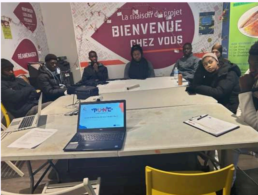
Organisation des événements