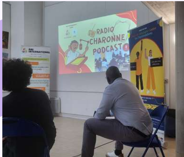
Outil de campagne contre les discriminations: podcast par ANI, la LICRA, et AEPCR