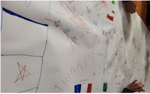
Fresque collective sur le thème de l'interculturalité