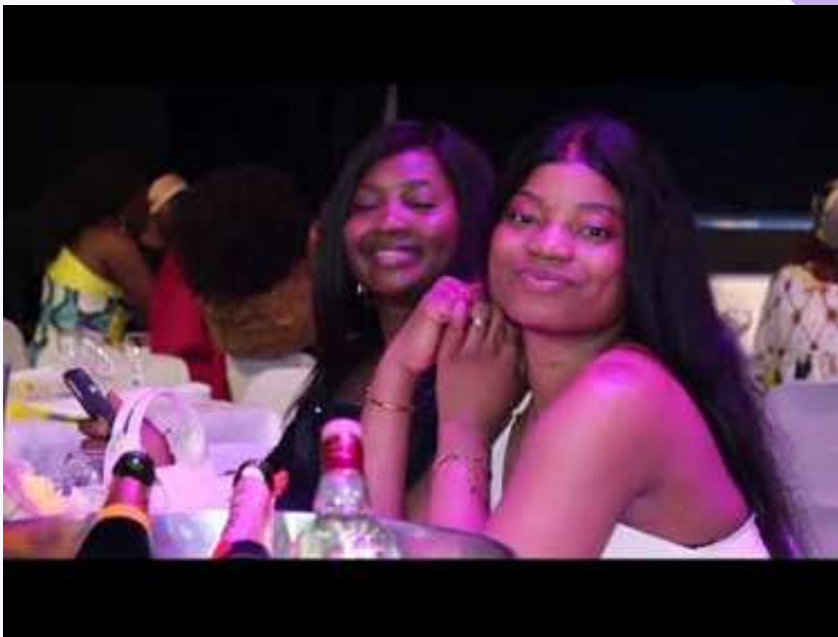
Organisation des événements