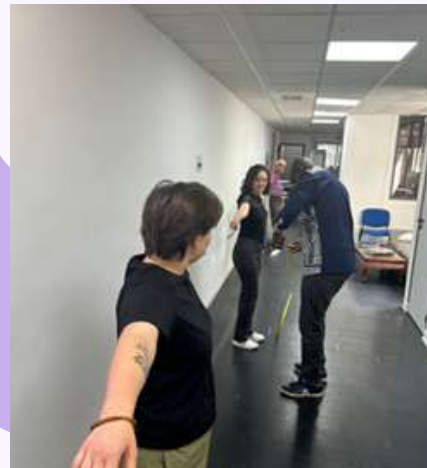
Atelier avec les jeunes de 16 à 25 ans