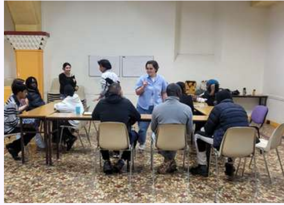
ANI et la LICRA: atelier radio sur le racisme