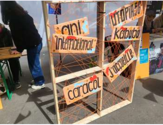
ANI@ S.W.A.G Outside 2024