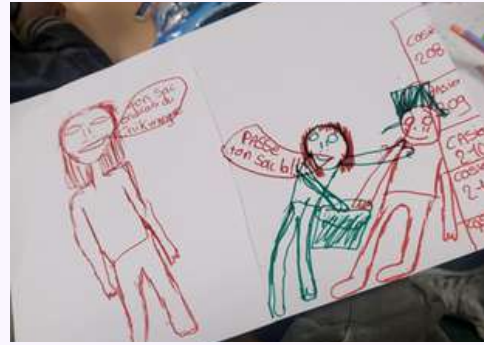
Outil de sensibilisation contre le harcèlement