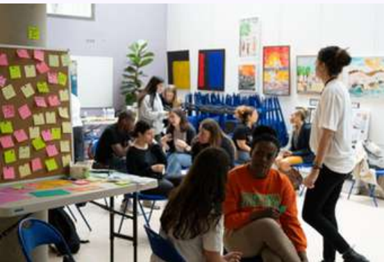
Forum tous en campagne contre les discrimination, édition 2024