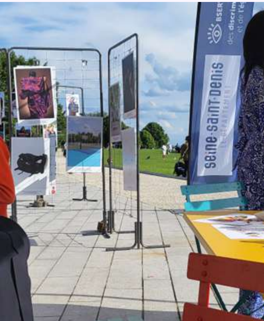
ANI@ la caravane des discriminations, étape Montreuil, avec le département Seine Saint Denis